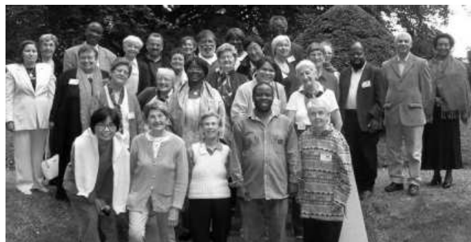
Internationale UFER conferentie