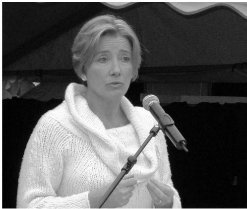
Actrice Emma Thompson vertelt bij de opening van ‘Journey’ in Den Haag het verhaal van een slachtoffer van mensenhandel. Haar publiek luistert ademloos en voelt de pijn en wanhoop die het meisje gevoeld moet hebben.