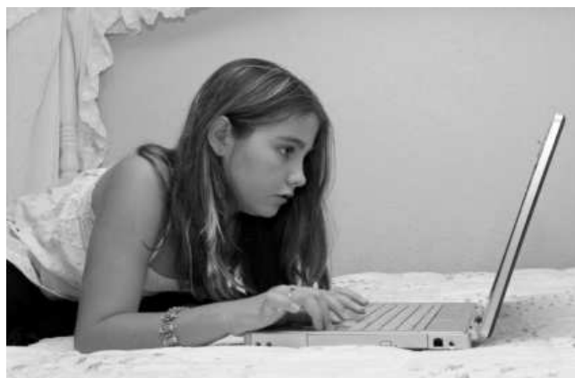
Meisjes zijn zeer actief op websites als Hyves en Facebook