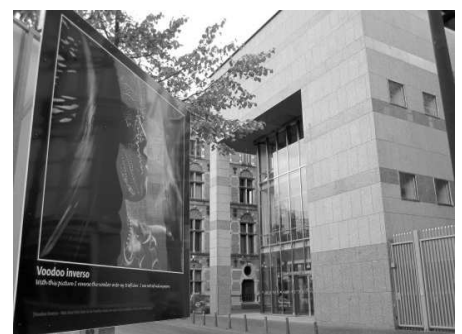
Deel fototentoonstelling voor het gebouw van de Tweede Kamer

De foto's van Kay Chernush waren tot 23 november te zien op het Plein in Den Haag. De openluchtexpositie Bought and Sold: Voices of Human Trafficking is een initiatief van BLinN, een organisatie die opkomt voor de belangen van slachtoffers van mensenhandel en uitbuiting. Van 19 oktober tot 16 november was in het Louis Hartloper Complex in Utrecht een selectie van de foto's te zien.