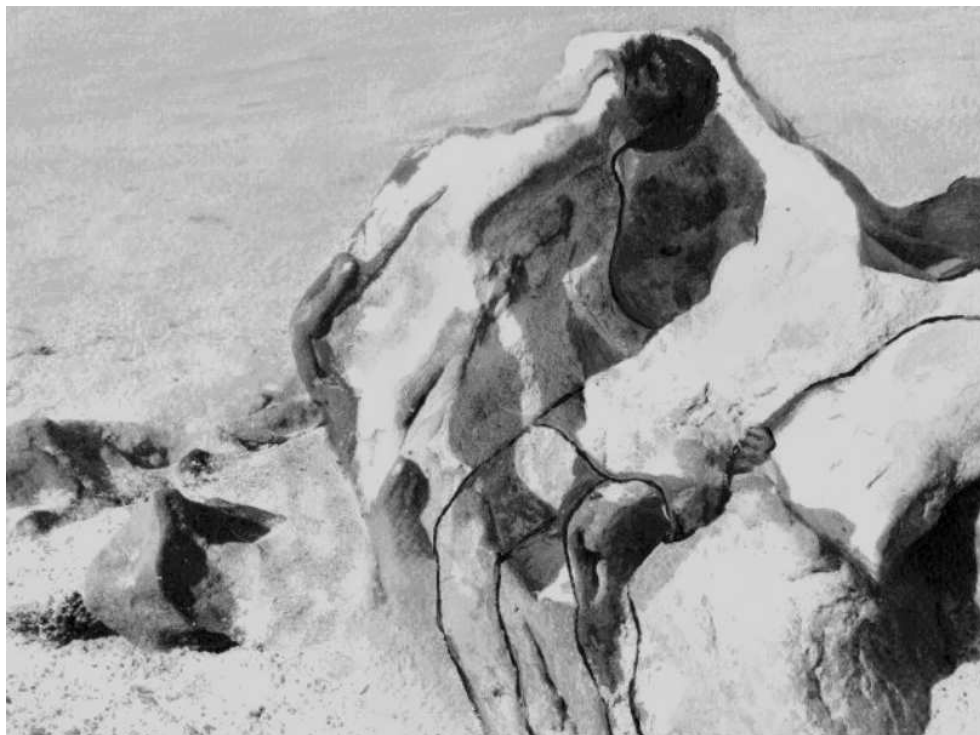
'Dood', een afbeelding van Mieke Borgdorff. Uit: 'Elena een bezinning op mensenhandel'

Kunst op de Amsterdamse Wallen . . . . 15