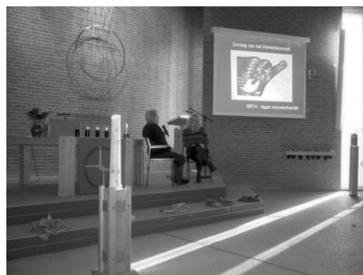
Zr. Mechtild in de Protestantse kerk in Geleen

van een klein team van mensen, van de stichteres van mijn congregatie en van God."