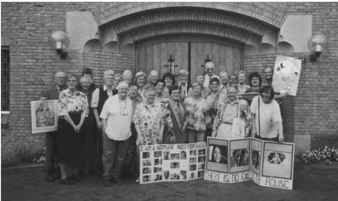
Werkgroep Religieuzen Tegen Vrouwenhandel 1997