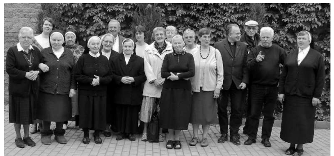
SRTV met zusters in Litouwen

Ons gesprek met 'Marta' duurde, onderbroken door een lunch, tot 15.00 uur.