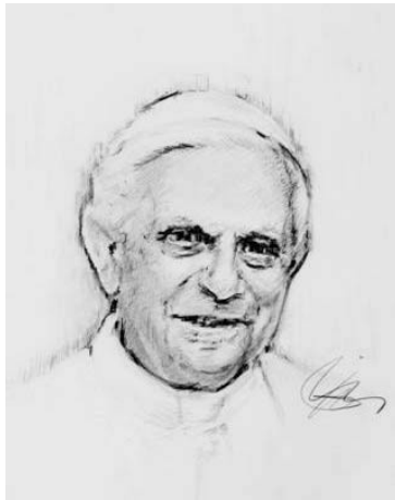
Paus Benedictus XVI

VATICANSTAD - Paus Benedictus XVI heeft de mensenhandel aangeklaagd in het kader van de economische mondialisering. Hij deed dat naar aanleiding van de Werelddag van de migrant en de vluchteling die door de katholieke Kerk wordt georganiseerd. De paus riep de katholieken in een boodschap op speciale aandacht te hebben voor de geïmmigreerde vrouwen die het meest kwetsbaar zijn voor economische exploitatie en voor mensenhandel.